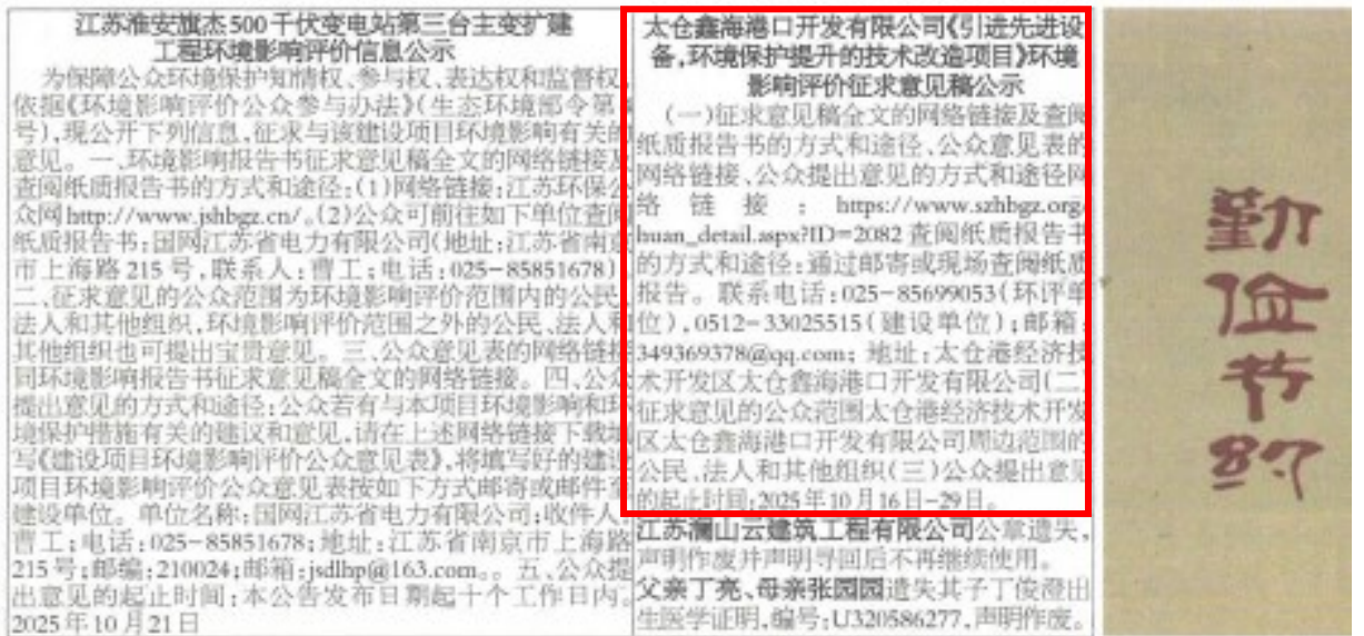
图 3-2 报纸信息公开照片

面积:83.11平方米,单价:3761元/平方米,预收购房款:200187.00元)发票丢失,代码:232031500100,号码:00020385,声明作废。 ●沛县河口镇李集村邓纪军不动产权证书丢失,不动产单元号:320322011015JC00535F00010001,权利人:邓纪军,声明作废。 ●沛县张寨镇新丽都超市法定名称章丢失,章号:3203220997829,声明作废。 ●胡方法、王妍妍购买润柏华庭(房号:37-404)购房发票丢失,发票号:07015406,金额:327085.00元,声明作废。 ●张梦秋太平洋保险公司执业证丢失,执业证书编号:法定名称章丢失,印章编码: ●丰县冯凯管饭店(个体工商户)法定名称章丢失,编号:票3203212084610,声明作废。 ●徐州苏晋文化传媒有限公司法定名称章丢失,备案号:财:3203120224067,声明作废。 ●徐州华之峰通讯工程有限公司法定名称章丢失,编号:字:32032120566572,声明作废。 ●徐州华之峰通讯工程有限公司财务专用章丢失,编号:声:32032120566573,声明作废。 ●江苏安兵建材有限公司合同专用章丢失,备案号:3203211977655,声明作废。 ●丰县凤鸣轩茶楼发票专用章丢失,换)